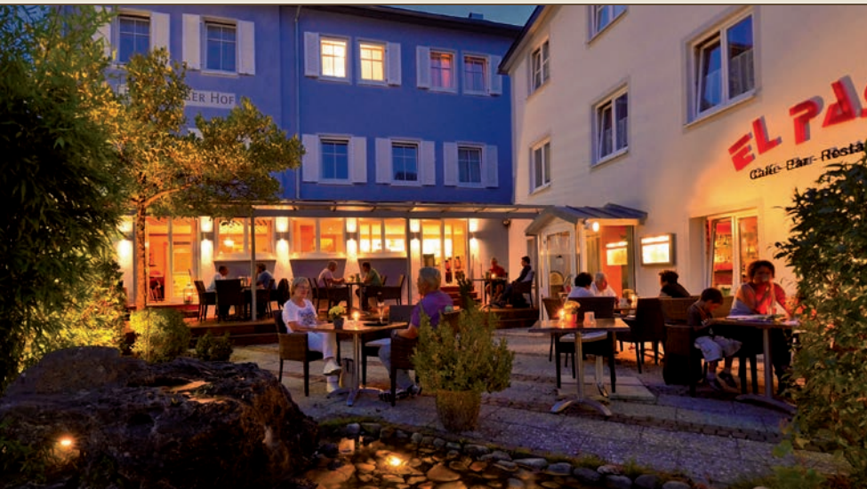
Unser großzügiger Gastgarten mit Loungeterminasse