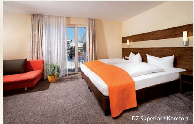
DZ Superior / Komfort

Je nach Wunsch können Sie aus verschiedenen Zimmerkategorien wählen: Von den charmanten, floral gestalteten Standardzimmern in unserem Stammhaus über die modernen, geräumigen Komfortzimmer mit hochwertiger Ausstattung im Neubau bis zum exklusiven Deluxe-Zimmer mit perfektem Schlafkomfort im Wasserbett ist für Sie sicherlich das Passende dabei.